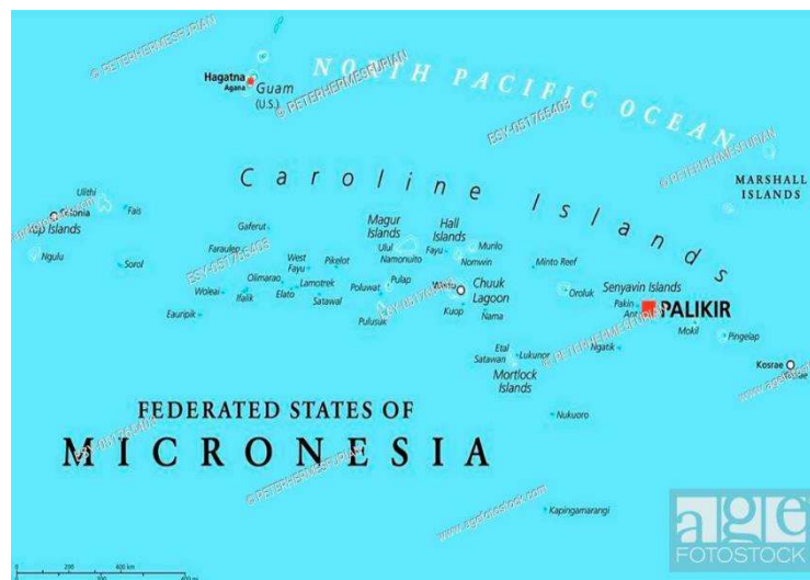
Mapas gentileza de google.