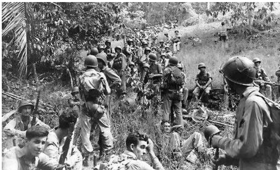
Tropas de marines estadounidenses en Guadalcanal

Desde el comienzo de 1944, la laguna de Truk, fue para el imperio japonés cada más insostenible logísticamente, porque al oeste los norteamericanos y los australianos comandados por el General MacArthur se habían estado desplazando por el Pacífico suroeste apoderándose de muchos enclaves nipones importantes dentro de la operación Cartwheel. Los Marines y el Ejército de Tierra a las órdenes del Almirante Chester W. Nimitz habían conquistado las cercanas islas Gilbert y Marshall.