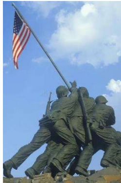
Statue of Iwo Jima, U.S. Marine Corps Memorial at Arlington National Cemetery, Washington

Después vendría en febrero de 1945 el desembarco de Iwo Jima, en el propio Japón, donde cayeron heroicamente casi todos los defensores nipones, izándose por muchos hombres la bandera de los Estados Unidos, hecho fotografiado por Joe Rosenthal y que aún hoy en día constituye el símbolo de la guerra del Pacífico contra Japón.