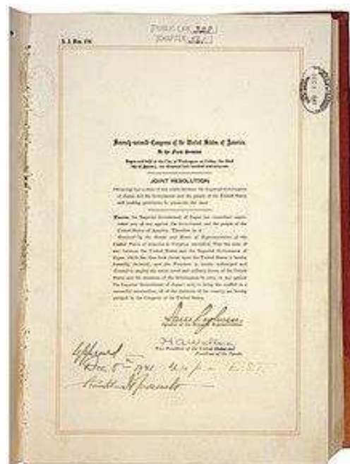
Declaración de guerra por el Congreso de los Estados Unidos a Japón el 8 de diciembre de 1941.

Al mismo tiempo, el 11 de diciembre, Alemania e Italia como potencias del Eje, declaraban la guerra a los Estados Unidos.