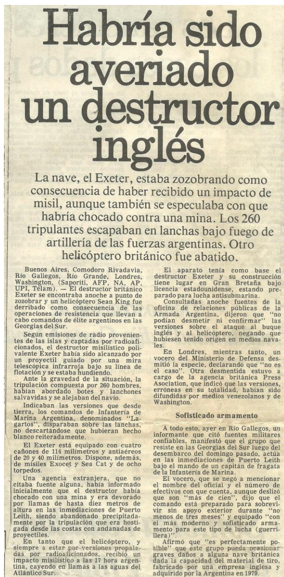
Imagen II: ahora los “Lagartos (Col. 1, Párrafo 3.)