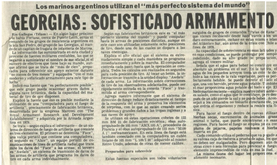
Imagen I: Nace el grupo de comandos "Patas de Rana (Col. 3, Lin. 1).