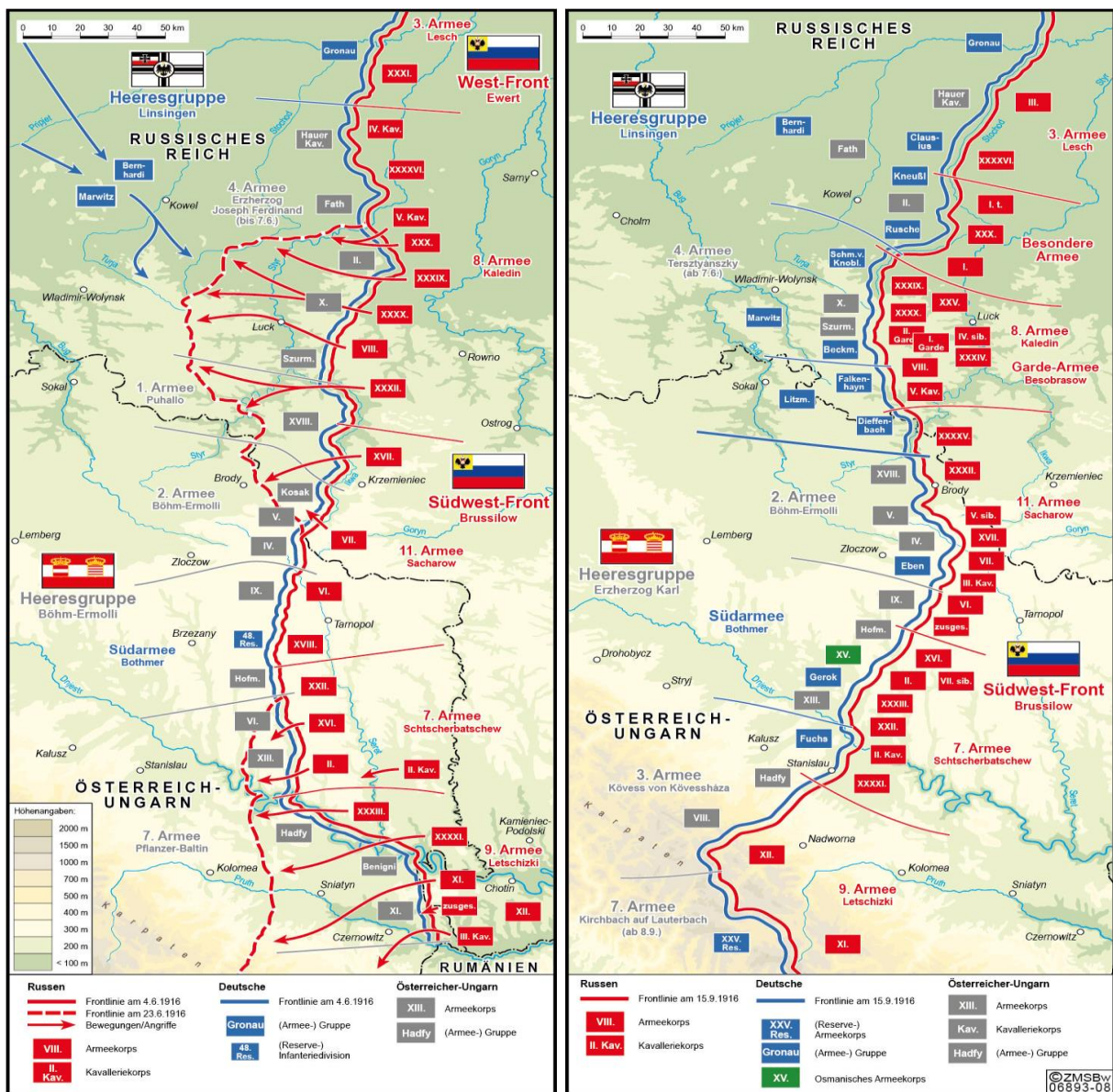
Mapa esquemático del desarrollo de la ofensiva de Brusilov de 1916

En el centro de la ofensiva hubo pocos avances rusos, que básicamente se limitaban a la toma de Brodi el 28 de julio. Más al sur, el Ejército del Sur alemán se hizo con la fama de ser invencible, por la resistencia firme que ofrecía contra el 7º Ejército ruso. En el extremo sur del país, en cambio, por los ríos Dniéster y Prut, el 9º Ejército ruso derrotó rotundamente al 7º Ejército austrohúngaro. Esta derrota desató una catástrofe porque significaba un serio peligro para Hungría e incentivó a Rumania, que hasta entonces había adoptado una postura neutra, a unirse a la guerra el 27 de agosto del lado de la Triple Entente. En una tercera fase, a partir del 28 de julio, fracasó el ataque ruso en la sección norte, en el que se intentaba ocupar Kóvel, causando graves pérdidas en la Guardia Rusa. También la ofensiva exitosa del 9º Ejército ruso en el sur, en Kucovina y en los Montes Cárpatos, se vio estancada a mitades de agosto por el aumento de la resistencia de las Potencias Centrales y por falta de reservas propias.