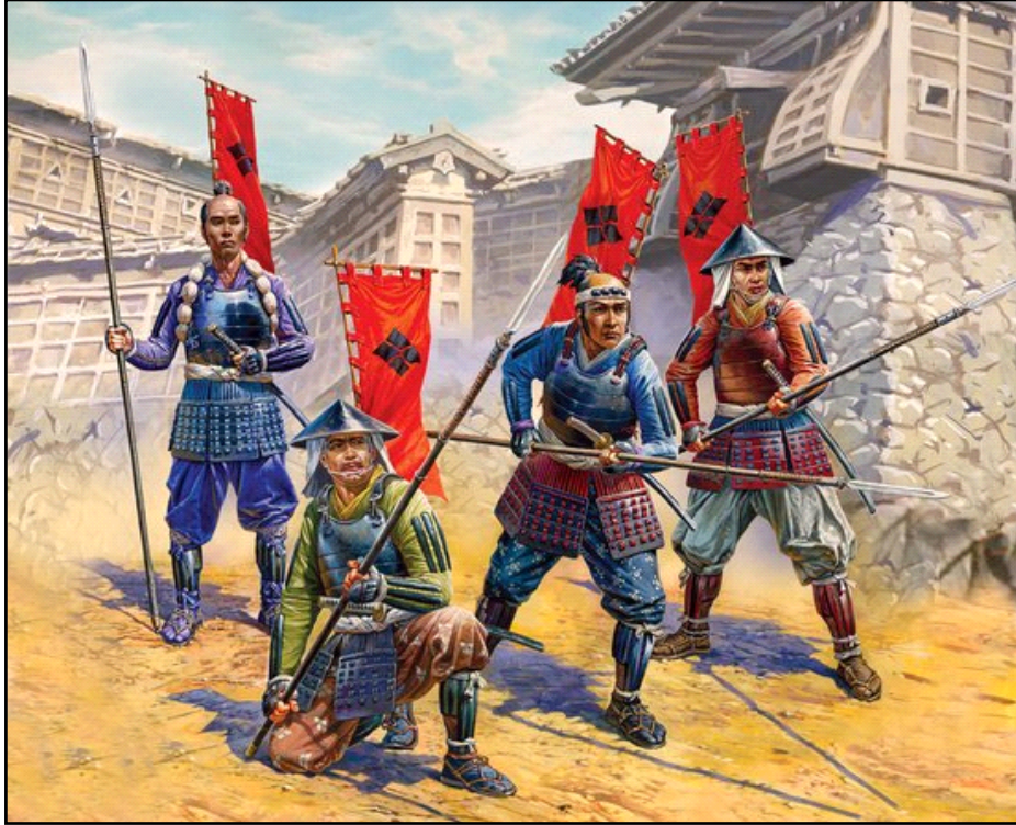
Ashigaru del Clan Takeda.

Es justo notar que cada vasallo en cada clan reunió diferentes tipos y números de soldados. Por ejemplo, los señores de la guerra en el oeste preferían las unidades de pólvora, mientras que los señores de la guerra en el este confiaban más en las unidades de jinetes y caballería. Es importante destacar esto porque las composiciones del ejército en términos de armamento, unidades y tácticas cambiaron mucho de un clan a otro.