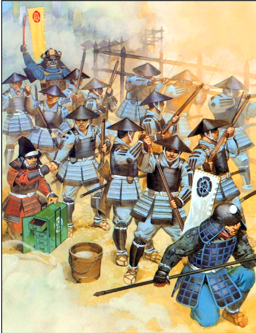
Arquebuceros Oda disparando continuamente sobre las barricadas.

El ejército de Takeda salió del bosque y se encontró entre 200 y 400 metros de las empalizadas de Ieyasu y Nobunaga. Katsuyori creía que tres factores le garantizarían la Victoria: La corta distancia, el gran poder de la carga de caballería, especialmente porque el Kiba Gundam ya había derrotado a Nobunaga antes; Y el más importante, la fuerte lluvia, que Katsuyori creía que inutilizaría los arcabuces de Nobunaga. Pero este fue su mayor error. Retenidos por sus oficiales samuráis, los artilleros de mecha de Oda, que habían mantenido la pólvora seca, aseguraron el fuego mientras la caballería de Takeda cargaba a través de la llanura.