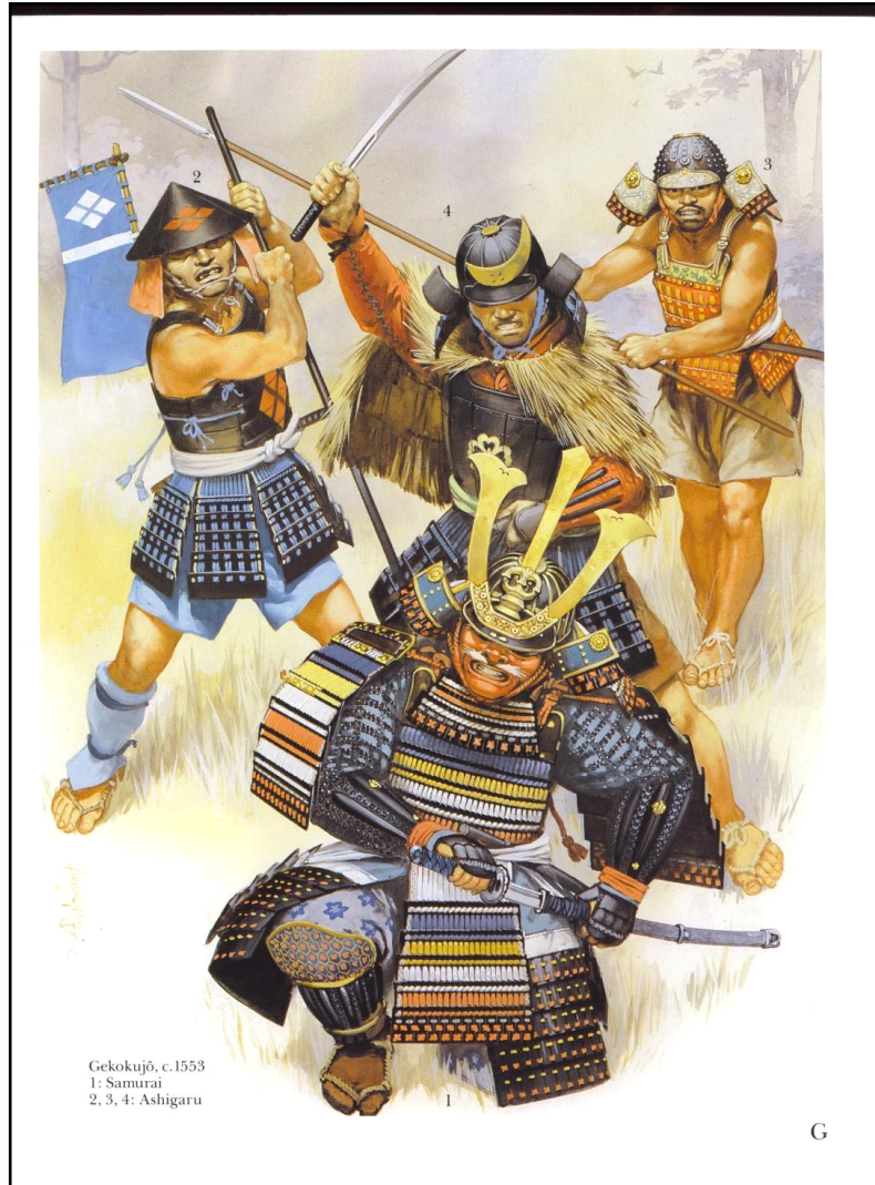
Ashigaru Atacán a un Samurai, un ejemplo de las diferentes armaduras en la Era Sengoku. Autor: Angus McBride.

podía tomar después de la batalla. Quizás el mejor ejemplo para la creación de uniformidad y eficacia entre las filas de ashigaru es la evolución de su armadura. El primer ashigaru simplemente traía cualquier armadura que poseía, a menudo ninguna, al campo de batalla y saqueaba lo que podía tomar después de la batalla.