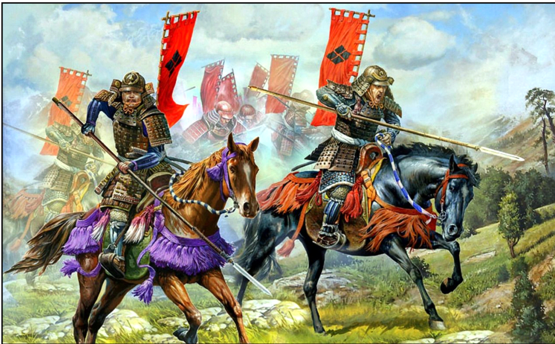
Samurais Montados de la Caballería del Clan Takeda.

mayor uso de infantería en grandes números, los samurais, que eran originalmente arqueros montados, fueron forzados a cambiar sus tácticas, una idea que comenzó con Shingen. El volvió a entrenar sus jinetes para convertirlos en lanceros, que quedarían conocidos como Takeda Kiba Gundam (Ejército Montado). Estos jinetes, y su carga de caballería, fue utilizada con gran efectividad en la Batalla de Mikatagahara, en 1573, contra el propio Nobunaga, mostrando que mismo después de su muerte, las ideas de Shingen seguían con vida.