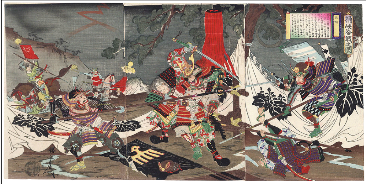
Ilustración tradicional de la Batalla de Okehazama, Autor: Chikanobu.

El “Tonto de Owari, después de establecer un ejército de mentira en el Santuario para confundir al enemigo, y avanza para enfrentarse a Yoshimoto, que acampara en la villa de Okehazama. Yoshimoto y sus hombres estaban celebrando sus victorias y veían las victorias por delante, luego serían señores de Japón, Pero Nobunaga no era en realidad tonto. Nobunaga, sob la cobertura de una fuerte tempestad, lanzó un ataque sorpresa con sus 2.000 soldados contra el ejército Imagawa cuando aún estaba en el campamento, varios de los samurais estaban sin armadura, en razón de creeren que habían ganado de los Oda. En el caos, dos samurais de Oda acabaran matando a Yoshimoto, así dispersando al ejército enemigo. La impresionante derrota se conoció como la Batalla de Okehazama y marcó la primer vez que Nobunaga notó los talentos de un joven portador de sandalias conocido como Kinoshita Tokichiro, o como es más conocido: Toyotomi Hideyoshi. Nobunaga formó una alianza con Matsudaira Motoyasu de Mikawa para asegurar su frontera oriental y entró en batalla con Saitō Yoshitatsu de Mino, al norte.