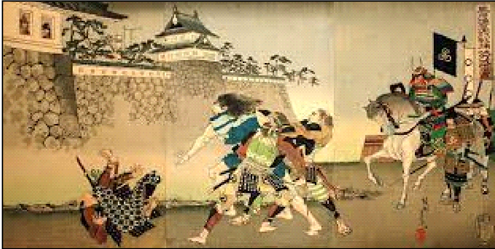
Ilustración tradicional de la captura de Torii Suneemon y su aviso para los defensores del castillo.

Cuando un explorador alertó a Takeda sobre la fuerza de socorro que se acercaba, sus generales aconsejaron al señor de la guerra que se retirara o lanzara un último ataque total contra el castillo. Si tal ataque tuviera éxito, argumentaron, las tropas de Takeda podrían encontrarse con la fuerza de socorro más grande desde detrás de los muros del castillo. En cambio, Takeda se puso del lado de sus generales más jóvenes, quienes lo instaron a enfrentarse a Oda en una batalla abierta. De los 15.000 sitiadores de Katsuyori, solo 12.000 se enfrentaron al ejército Oda-Tokugawa en batalla, con los demás 3.000 continuando el asedio para evitar que la guarnición del castillo saliera y se uniera a la batalla.