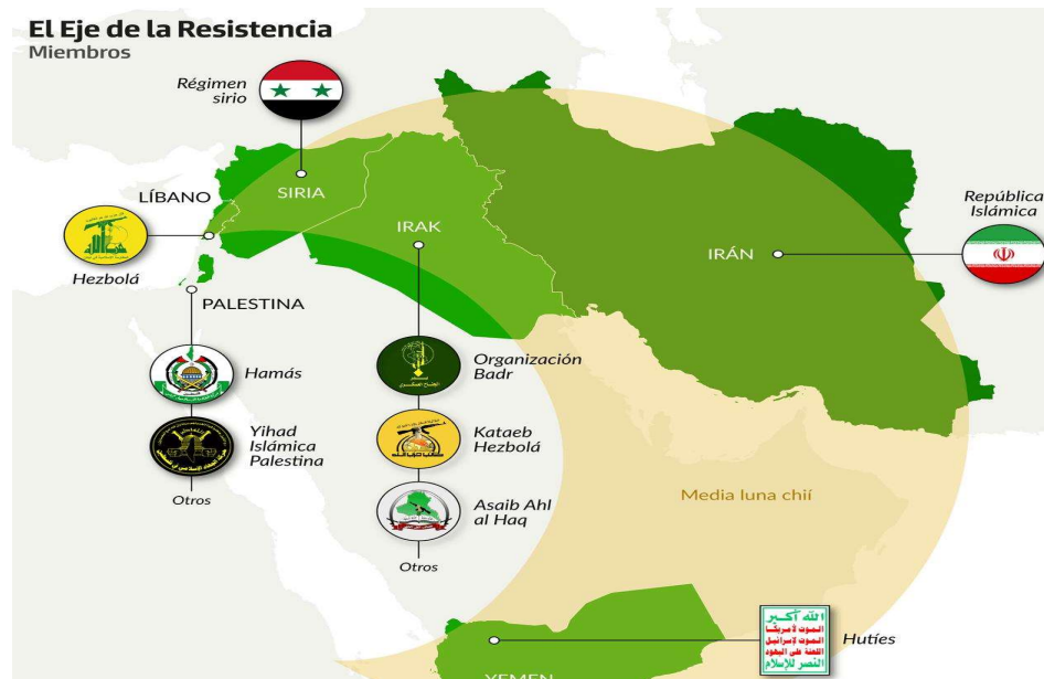
Figura 4. Mapa de la Región de la Península Arábiga y los principales aliados de Irán. Citado por Alvaro Merino, EOM. (2023).