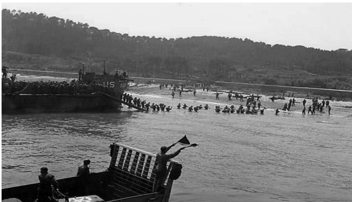
Desembarco de tropas estadounidenses en una playa de Provenza.

castigo del litoral, los minadores tendieron artefactos acuáticos para impedir cualquier ruta de salida a los submarinos o lanchas de la Marina de Guerra Aliada, al mismo tiempo en que se utilizaron unas barcasas de tipo LCVP denominadas « Apex » para retirar las barreras y obstáculos bajo el agua. Gracias a esta coordinación a las 7 :15 horas el camino marítimo hacia Provenza estuvo completamente despejado, todo lo contrario que en el bando del Eje porque los « maquis » de la Resistencia Francesa cortaron los cables telefónicos y dejaron incomunicado por un tiempo al Grupo de Ejércitos G con el Alto Mando Alemán (OKW) en Berlín.