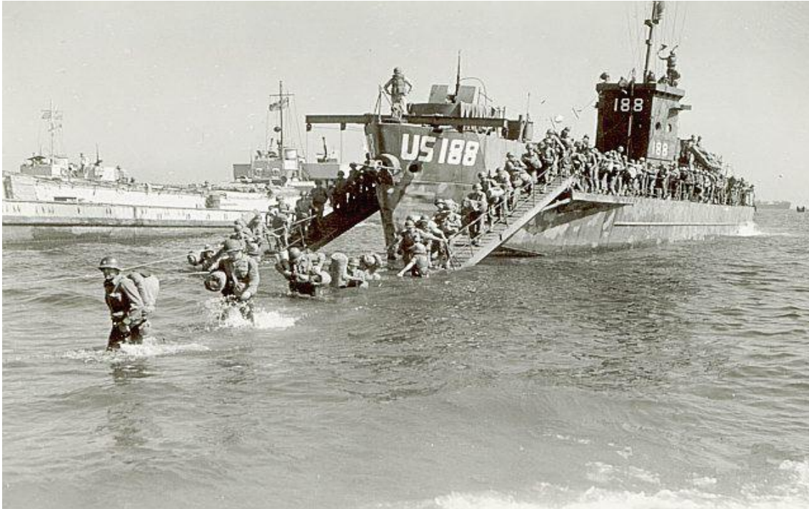
Desembarco de la Tercera División de Infantería Americana cerca de Draguignan

De los 450.000 soldados que tomaron parte en la Operación Dragón, unos 200.000 pertenecían a tropas francesas. De estos, aproximadamente la mitad eran los conocidos como "soldados indígenas", de origen africano. Simultáneamente a la Operación Dragón los aliados efectuaron otras operaciones complementarias: