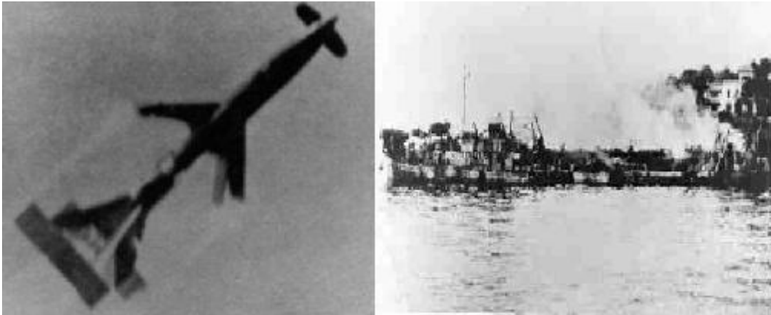
Izquierda: Bomba teledirigida Fritz X-1 alemana. Derecha: Hundimiento de la barcaza LST-282 a causa de una Fritz X-1.