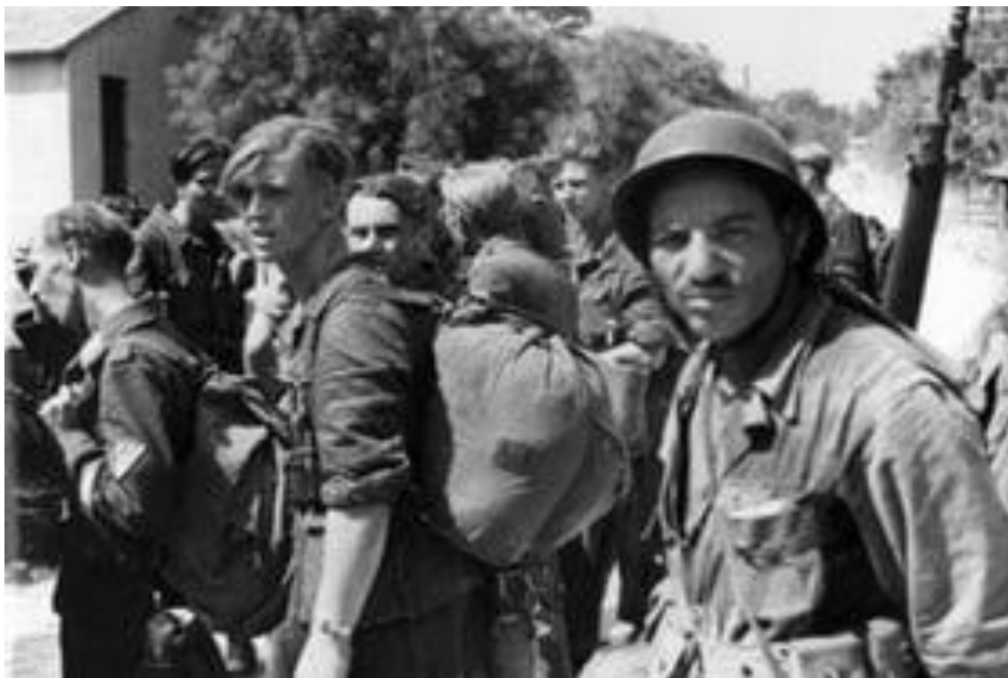
Prisioneros alemanes bajo la vigilancia de un soldado argelino en Marsella, en el sur de Francia, en agosto de 1944

« Delta Green » porque 4 tanques Sherman DD fueron destruidos por minas enterradas en la arena, antes de que los soldados se hicieran con la playa y los buques de la Flota Aliada silenciaron a cañonazos desde el mar a las molestas baterías germanas de 75 milímetros.