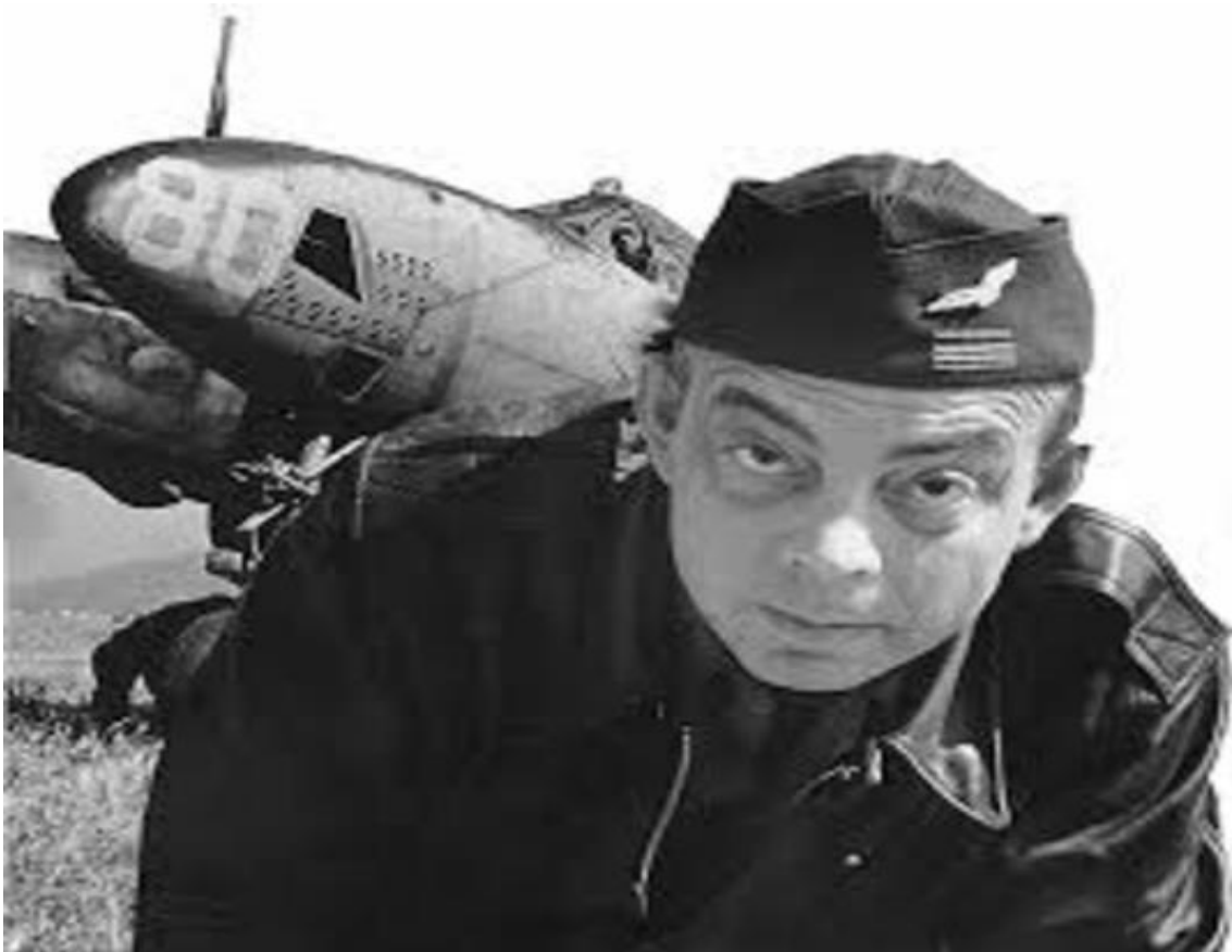
Antoine de Saint-Exupéry, autor de "El Principito", junto a su P-38

Marsella, Cannes y Niza habían sido ocupadas y se había alcanzado la frontera italiana. El Séptimo Ejército hizo más de 250 000 prisioneros. Finalmente la Fuerza Dragón enlazó a mediados de septiembre con el ala sur del Tercer Ejército de George Patton, procedente de la operación “Overlord” , cerca de Dijon. Después de la batalla a los aliados se les presentó el problema de que ni el puerto de Tolón ni el de Marsella podrían ser utilizados de momento. Tolón era solo un montón de escombros, y en Marsella el almirante alemán Heinrich Ruhfus había hecho saltar 9000 metros de muelles, destruido 200 grúas y hundido 70 barcos. Además ambas ciudades habían sufrido severos daños a causa de una acción prematura del movimiento de resistencia francés. El rápido avance después de “Cobra” (operación aliada que rompió el frente en Normandía) y “Dragoon” se ralentizó hasta casi detenerse en septiembre de 1944, debido a una crítica falta de suministros. Pero una vez comenzaron a repararse los destrozos en el puerto de Marsella y en las líneas de ferrocarril, se abrió una significativa ruta de suministros para el avance hacia Alemania a través del sur de Francia. Miles de toneladas de pertrechos descargados en los puertos franceses del Mediterráneo conseguidos gracias a “Dragoon” fueron enviados al noroeste de Francia para compensar las inadecuadas instalaciones portuarias de Bretaña y Normandía, proporcionando un tercio de las necesidades de las fuerzas aliadas.