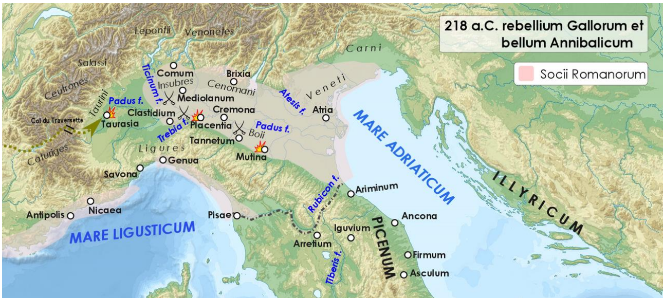
Campana púnica en la Italia del norte.

montado sobre el río Tesino. Los romanos sufrieron 500 muertos y buena parte de sus caballos fue capturada por los púnicos. Lo mejor, fue demostrar a los galos cisalpinos y otros aliados, como los ligures, que roma no era invencible y haciendo que engrosaran sus fuerzas hasta unos 40000 efectivos. El cónsul Tiberio Sempronio Longo, desvió sus fuerzas, las cuales estaban prestas para invadir África, justamente para reforzar el vapuleado ejército de Escipión, el cual estaba herido y había sido salvado por su hijo. Luego fueron por el río Trebia y acamparon otra vez en Plasencia. Es allí donde el cónsul Tiberio Sempronio Longo pudo al fin unirse a las fuerzas de Escipión.