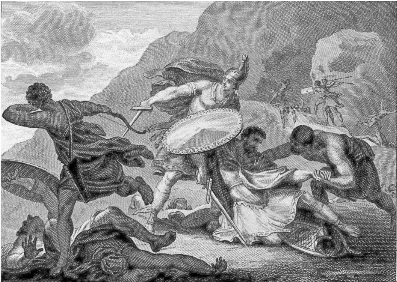
El joven Escipión rescatando a su padre herido.

https://en.wikipedia.org/wiki/Battle_of_Ticinus#/media/File:D%C3%A9faite_de_Scipion_pr%C3%A8s_du_T%C3%A9assin_(cropped).jpg